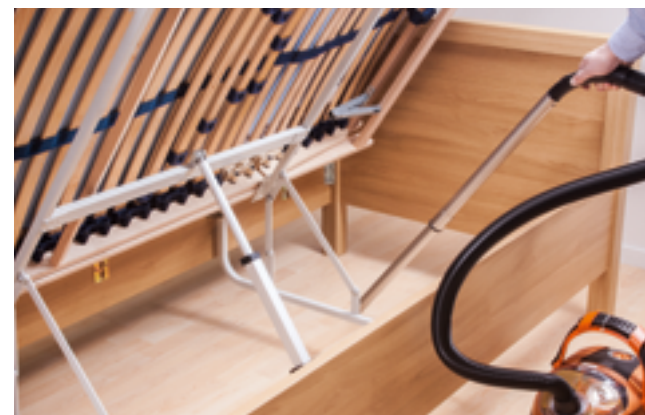
perfekte Reinigungsmöglichkeit des Zwischenraumes Liegefläche / Bettrahmen