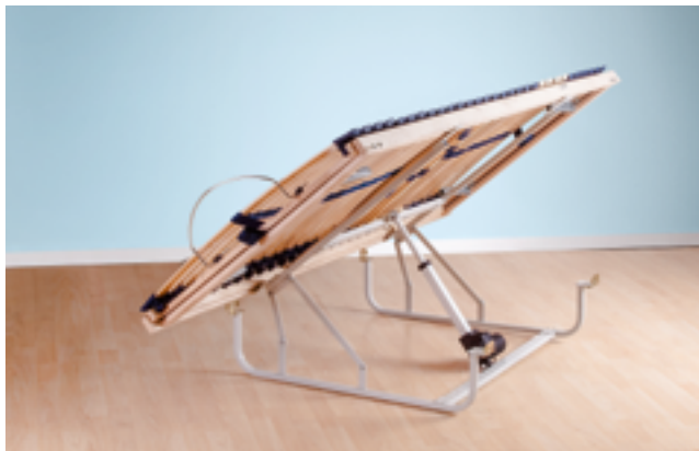
Matratzenheber mit montierter Liegefläche