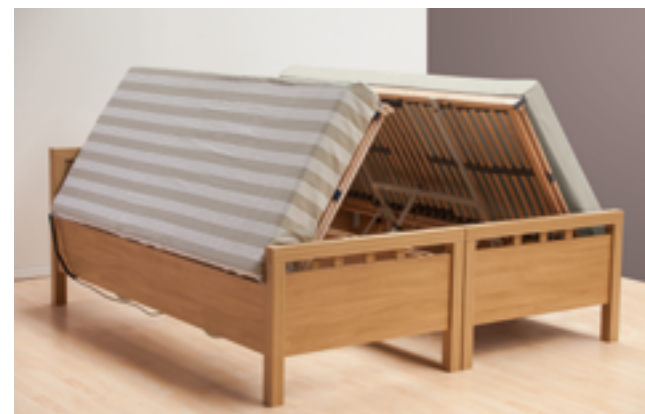
Möglichkeit der gleichzeitigen Liegeflächenanstellung