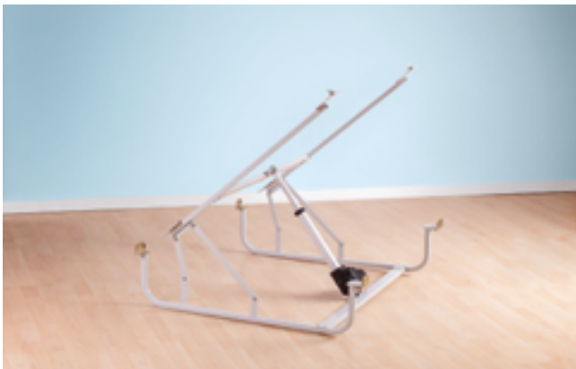
matolift mit Hebemotor

Dies stellt eine große Erleichterung und körperliche Entlastung für alle mit diesen Tätigkeiten betrauten Personen dar. Und vor allem: man kann jede bestehende Liegefläche nutzen!