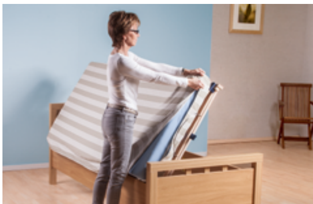
Austausch des Matratzenbezuges