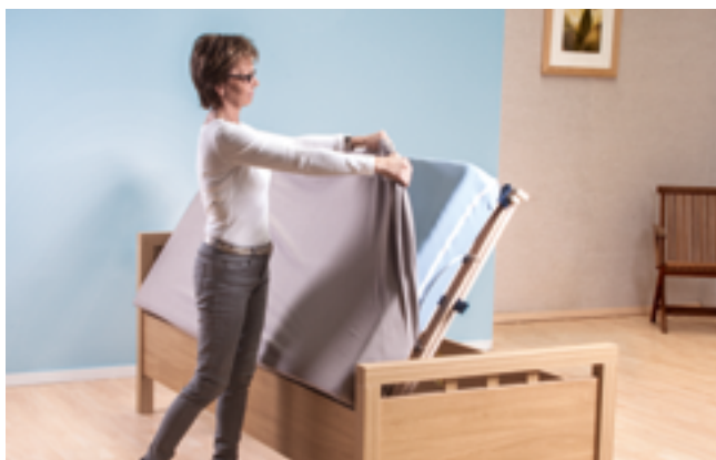
Neubeziehen des Spannbettuches

Nach dem Aufstellen der Matratze ist das Reinigen des Zwischenraumes von Liegefläche und Bettrahmen einfach, zusätzlich kann der Raum unter dem Bett als zusätzlicher Stauraum verwendet werden.