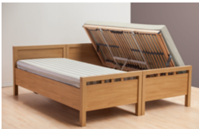
einseitiges Anstellen der Liegefläche durch den matolift