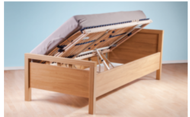
Einbau des matolift im Bettrahmen