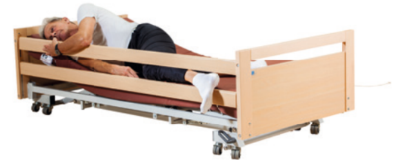
· wenn der Patient in das Bettgitter hineinrollt