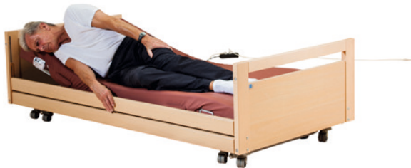
· wenn der Patient aus dem Bett zu fallen droht