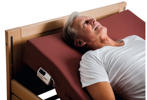
Egal in welcher Position sich das Bett befindet, die Funktionen von Kognimat werden nicht beeinflusst!