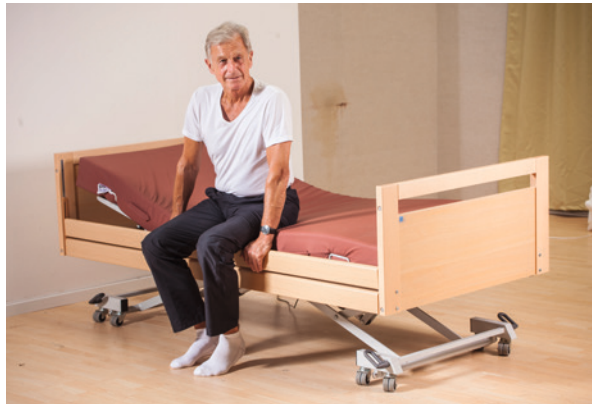
· wenn der Patient auf dem Bettrand sitzt