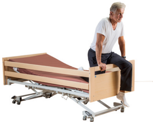
· wenn der Patient versucht, über die Enden des Bettes zu steigen