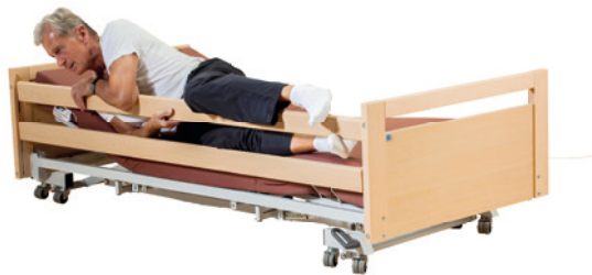
· wenn der Patient versucht, über das hochgezogene Bettgitter zu steigen