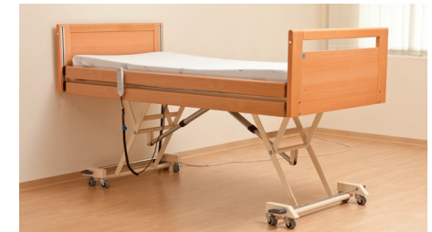
höchste Position 80cm