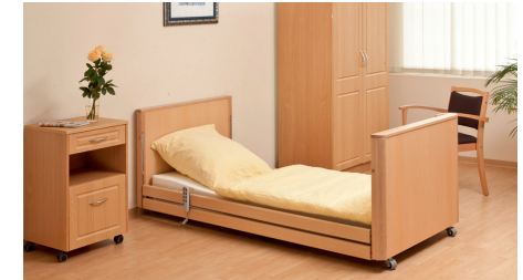
niedrigste Position 13cm