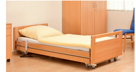
niedrigste Position 20cm