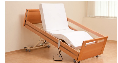
maximale Verstellung der Liegefläche