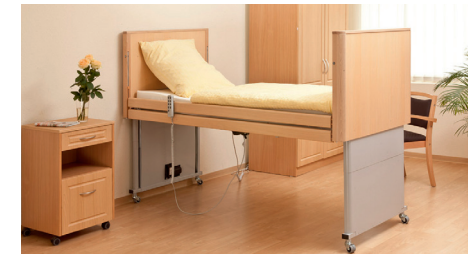
höchste Position 80cm