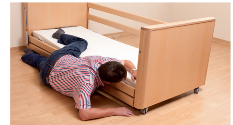
keine Verletzungsgefahr beim Herausrollen