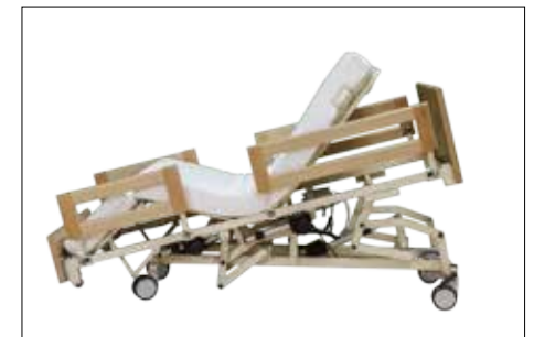
Sitz- und Pflegeposition