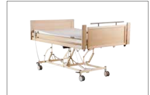
Hochstellung der Liegefläche