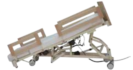
Trendelenburg / Anti-Trendelenburg