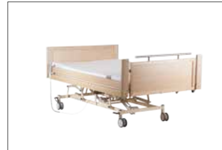
Tiefstellung der Liegefläche