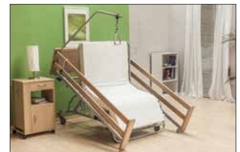
forza aktiv mit durchgehenden Seitengittern