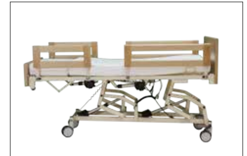
Hochstellung der Liegefläche