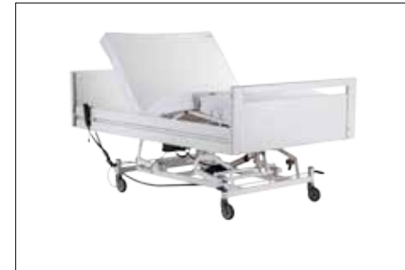
Kopf- und Fußteilverstellung