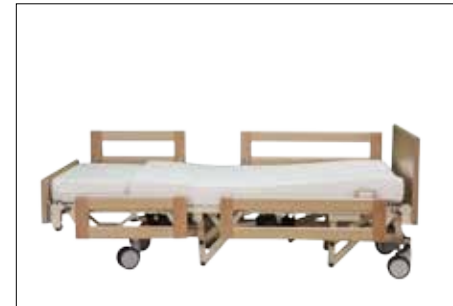
Tiefstellung der Liegefläche / Liegeposition