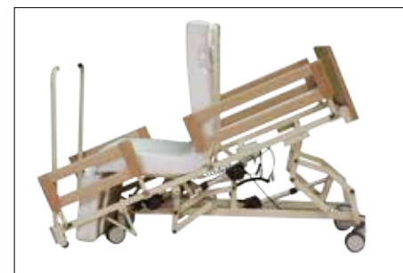
Sitz- und Ausstiegsposition