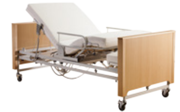
2. Kopf- und Fußteilverstellung