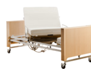
3. Drehung der LF um 45°