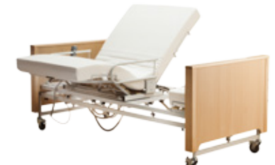
4. Drehung der LF um 90°